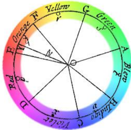
(شكل ١) عجلة ألوان نيوتن

في البداية لا بد أن نذكر أنه كانت هناك محاولات عبر زمن طويل للربط بين اللحن (المسموع) باللون (المرئي)، خاصة منذ قام نيوتن بالربط بين ألوان الطيف السبعة (الأحمر، البرتقالي، الأصفر، الأخضر، الأزرق، النيلي، البنفسجي) ونغمات السلم الموسيقي السبع: دو، ري، مي، فاء، صول، لا، سي (A, B, C, D, E, F, and G). وفعل ذلك بتجربة تحليل الضوء الأبيض المرئي من خلال طيف الضوء المنشوري ثم باستخدام منشور آخر قام بإنتاج الضوء الأبيض مرة أخرى. وبمعرفة بالموسيقى، قام بوضع النغمات الموسيقية السبع داخل أوكتاف octave، مقترنة بالألوان الطيف السبعة، وصور ذلك في شكل عجلة عُرفت باسم "عجلة ألوان" نيوتن (شكل ١).