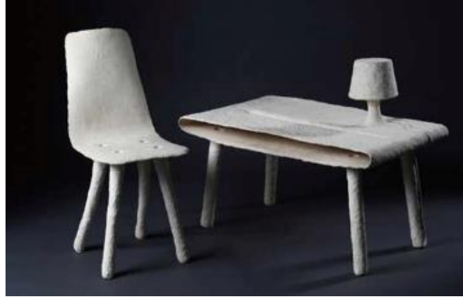
صورة توضح نموذج لقطع أثاث مصنعة من ألياف مصاصة قصب السكر.