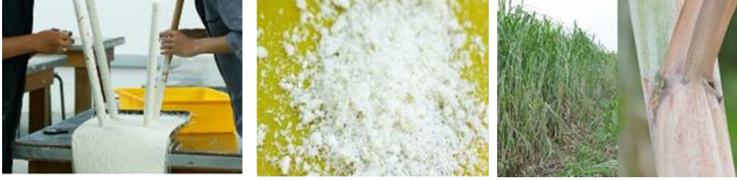
صور توضح مراحل استخدام ألياف مصاصة قصب السكر في الأثاث.