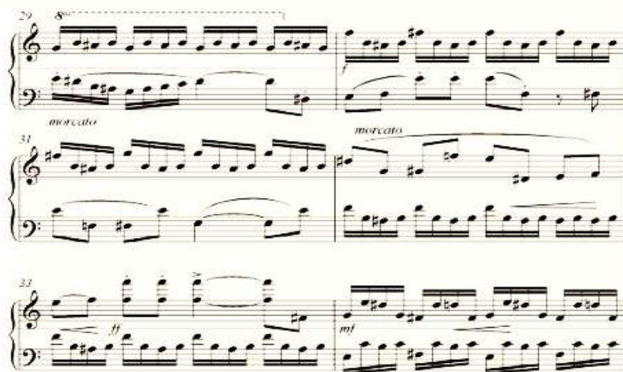
شكل رقم (١٧) يوضح من مازورة (٢٩ : ٣٤) . م٣٦ تتابع تألفات رباعيات مفرطة بصورة هابطة انتهى على نغمة (رى) في م ٣٧ ١