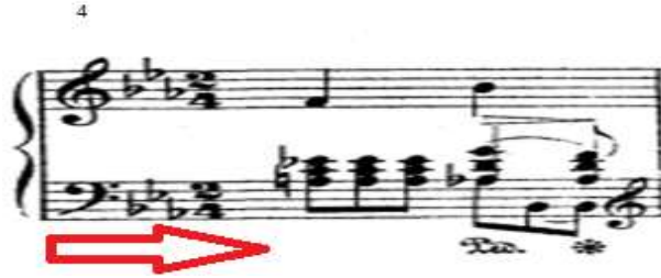
شكل رقم (٧) يوضح شكل الدواس في بريليود رقم (١)

هذا النوع من البيدال يسمى " Half Pedal " الذي يستخدم لتوضيح النغمات اللحنية ، وغالباً ما يجد الطالب صعوبة بالغة في أدائه بالطريقة الصحيحة ، ويظهر في موازير في (٢٠، ١٣، ٤). وتظهر في المدونة كما في الشكل الآتي :