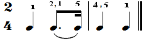
شكل رقم (٤) يوضح الصعوبة

- علامة الأداء Tenuto (-) مصطلح من الأداء المتقطع الثقيل . الحليات : لم تظهر حليات في هذا البريليوود . الدواس (البدا): حدد المؤلف أماكن استخدام البيدال في كل من مازورة (٢٠,١٣,٤) يهدف التلوين التعبيري والحفاظ علي الأداء المترابط . ثالثاً : التقنيات العزفية لبريليوود البيانو رقم (١) : يهدف التحليل العزفي إلي تحديد التقنيات العزفية التي تشتمل عليها مدونات البريليوود ، وتوضيح سبل أداءها لتذليل الصعوبات الأدائية . وإشتملت البريليوود علي عدة تقنيات عزفية نوجزها فيما يلي : * التقنية الأولى : تبديل إصبع السبابة بإصبع الإبهام لسهولة العزف : عزف أول نغمة في المازورة بإصبع الإبهام (الأول) والشكل الثاني في المازورة يبدأ بالعزف بإصبع السبابة (الثاني) مع تبديل وتغيير الإصبع مرة أخرى لإصبع الإبهام لسهولة عزف النغمة التالية في الشكل الإيقاعي ، وظهرت في موازير (١,٢,٤,٢٣,٢٧,٣٦) ، وهذا الشكل يشكل صعوبة لدى الدارس كما في الشكل التالي :