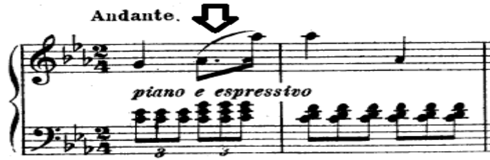
شكل رقم (٤) يوضح مسافة الأوكتاف في م ١ مشار إليها بسهم .

أداء مسافة الأوكتاف الحنية المساعدة التي تخضع إلي قوس لحنى قصير Slur في اليد اليمنى ، جاء هذا في مازورة (١, ٥) ، وهذه تشكل صعوبة علي العازف ، ويظهر كما في الشكل التالي :