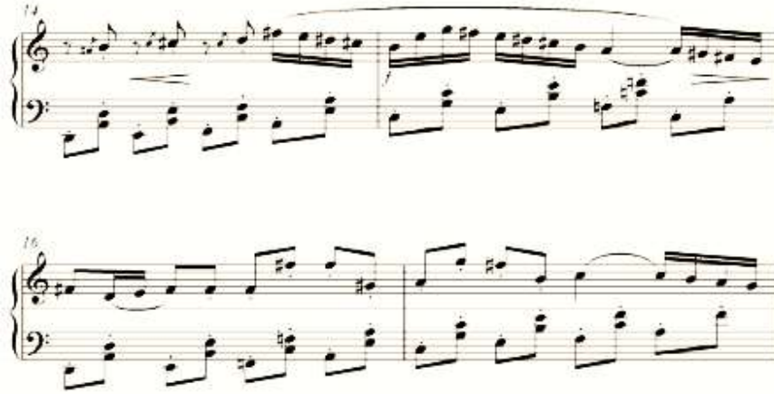
شكل رقم (١٣) يوضح من م (١٤ : ١٧) .

***** من م ١٨ : م ٢٠ استخدم التآلفات الرباعية مفرطة مع قفزة يليها تتابع سلمى هابط .