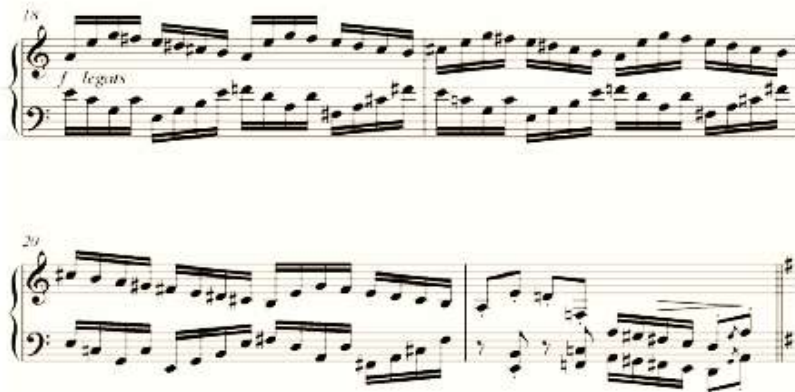
شكل رقم (١٤) يوضح من م (١٨ : ٢١) .

في م ٢١ انتهى علي نغمة (لا) في صورة قفلة نصفية في سلم (رى / لا) في اليدين والشكل التالي يوضح ذلك :