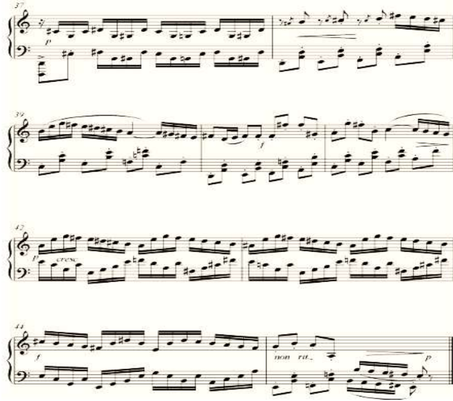
شكل رقم (١٩) يوضح الجزء الختامي لبريليوود رقم (١)