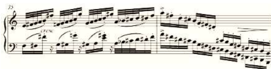
شكل رقم (١٨) يوضح مازورة (٣٥ ، ٣٦) .

**** من م٣٧ : م٤٤ ١ إعادة لـ م٣ : م٢٠ ١ ، من م٤١ : م٤٢ تألفات صغيرة بالسابقة من م٤٤ : م٤٥ جزء ختامى انتهى على المركز التونالى (مى /ص) . والشكل التالي يوضح ذلك :