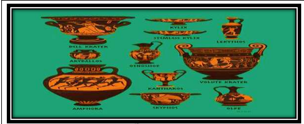
شكل (٤) (٣)