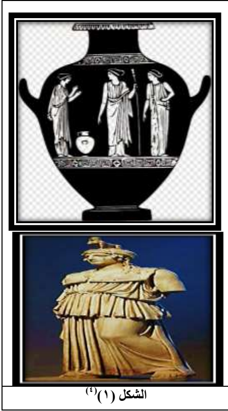
الشكل (١) (٤)

في اليونان في المئتي عام السابقة شهد القرن السابع قبل الميلاد التطور البطيء للطرز العتيق كما يتضح من النمط الأسود للرسم الزهرية. تعد تقريباً فترة ٥٠٠ ق.م، قبيل الحروب الفارسية بفترة وجيزة (٤٨٠ ق.م - ٤٤٨ ق.م)، بمثابة الخط الفاصل بين العصور القديمة والعصر الكلاسيكي ، ويعد عهد الإسكندر الأكبر (٣٣٦ ق.م - ٣٢٣ ق.م) فترةً فاصلةً بين العهدين الكلاسيكي والهنستي. (٢) سجل بلينين مؤرخ روما القديمة الأكثر أهمية كل ما يتعلق بالفنون، وأشار إلى أن الفن بجميع أشكاله تقريباً المناظر الطبيعية ولوحات البورتريه كان متقدماً في