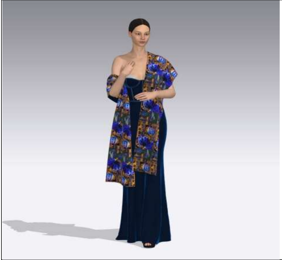
التوظيف الأول للتصميم