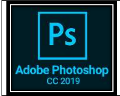
شكل (٥) (٤)