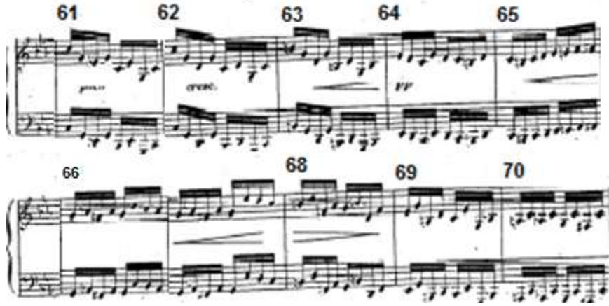
شكل رقم (٣) يوضح الإعادة الثانية للحن الأول في الدراسة الثالثة