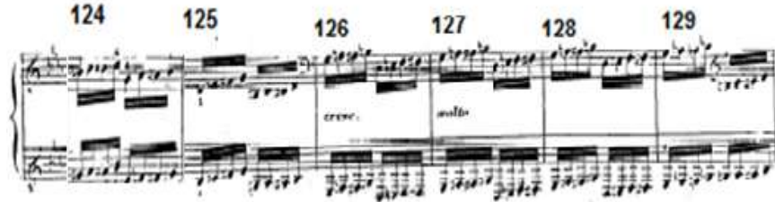
شكل رقم (٥) يوضح الإعادة الرابعة للحن الأول في الدراسة الثالثة ٢- اللحن الثاني :

من م ١٣٢ : م ٢٨٥ ( بدأ في سلم (دو الصغير) وإنتهى علي الدرجة السادسة لنفس السلم. والشكل التالي يوضح ذلك: