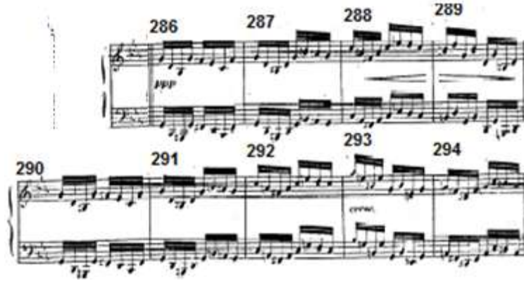
شكل رقم (٧) يوضح الإعادة الأولى للحن الثاني في الدراسة الثالثة • الإعادة الخامسة للحن الأول الأساسي: من م ٣١٩ : م ٤٢٠ (بدأ في سلم (دو الصغير) وإنتهى في نفس السلم. والشكل التالي يوضح ذلك: