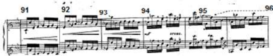
شكل رقم (٤) يوضح الإعادة الثالثة للحن الأول في الدراسة الثالثة

• الإعادة الرابعة للحن الأول الأساسي (إعادة جزئية):