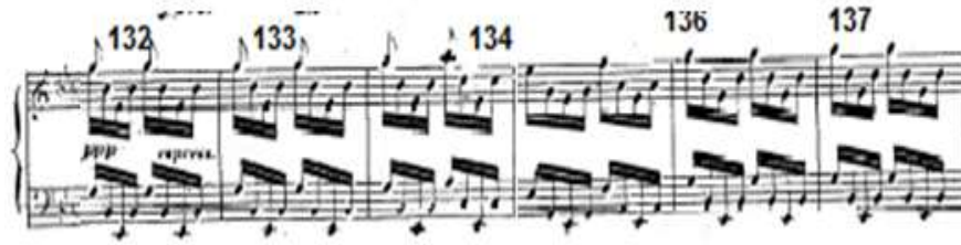
شكل رقم (٦) يوضح اللحن الثاني في الدراسة الثالثة • الإعادة الأولى للحن الثاني :

من م ١٣٢ : م ٢٨٥ ( بدأ في سلم (دو الصغير) وإنتهى علي الدرجة السادسة لنفس السلم. والشكل التالي يوضح ذلك: