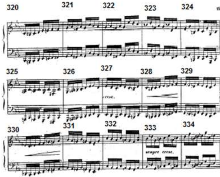
شكل رقم (٨) يوضح الإعادة الخامسة للحن الأول الأساسي