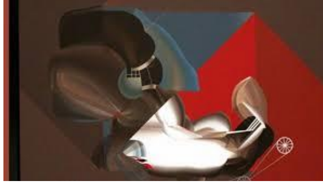
شكل (٣) لوحة الشهيد، أكريلك علي قماش، ٦٠x٦٠سم

النفس بالأرضية، أما الأجزاء ذات الطاقة المرتفعة فتتنظم مع بعضها وهذا ماأسميه بالشكل" (١)، شكل رقم (٣)، للفنان أحمد نوار .