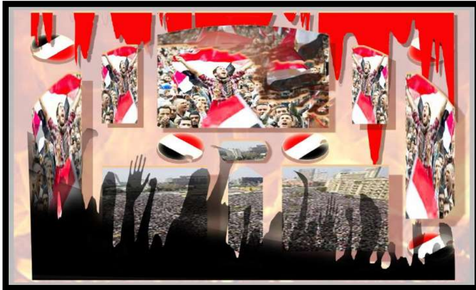
عمل رقم (٤)

لوجو مستلهم من الثورة المصرية تصميم وتنفيذ الباحثة