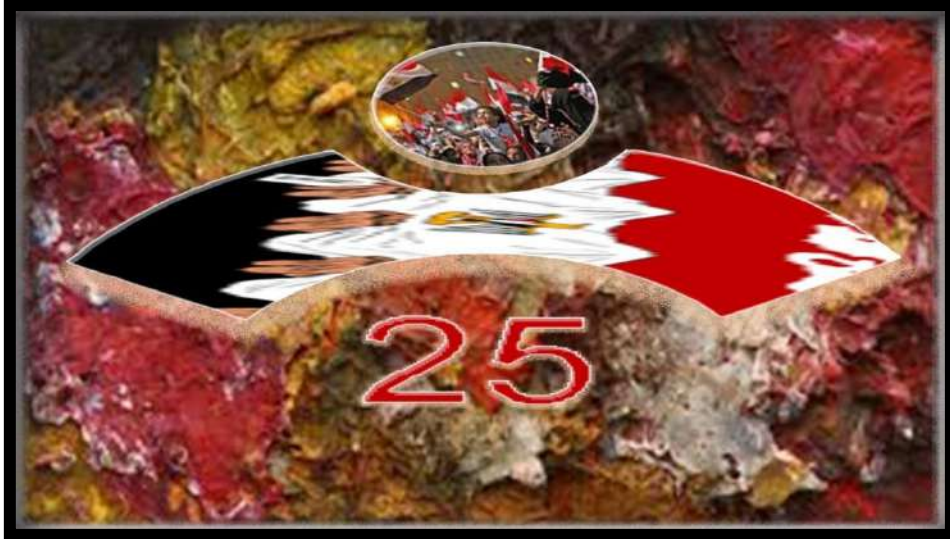
عمل رقم (٣)

لوجو مستلهم من الثورة المصرية تصميم وتنفيذ الباحثة