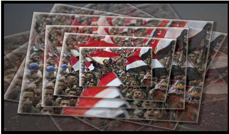
عمل رقم (٢)

لوحة تشكيلية قائمة على التكرار المنتظم للعناصر تصميم وتنفيذ الباحثة