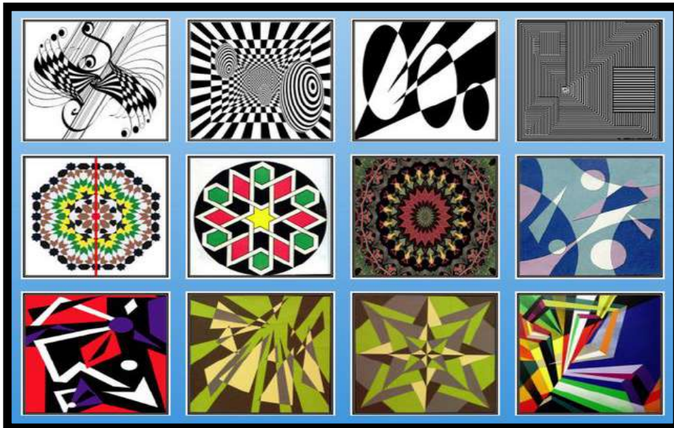
شكل رقم (٥)