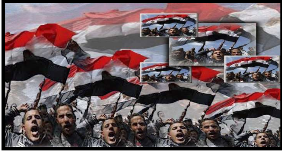
عمل رقم (١)

لوحة تشكيلية قائمة على التكرار المنتظم للعناصر تصميم وتنفيذ الباحثة